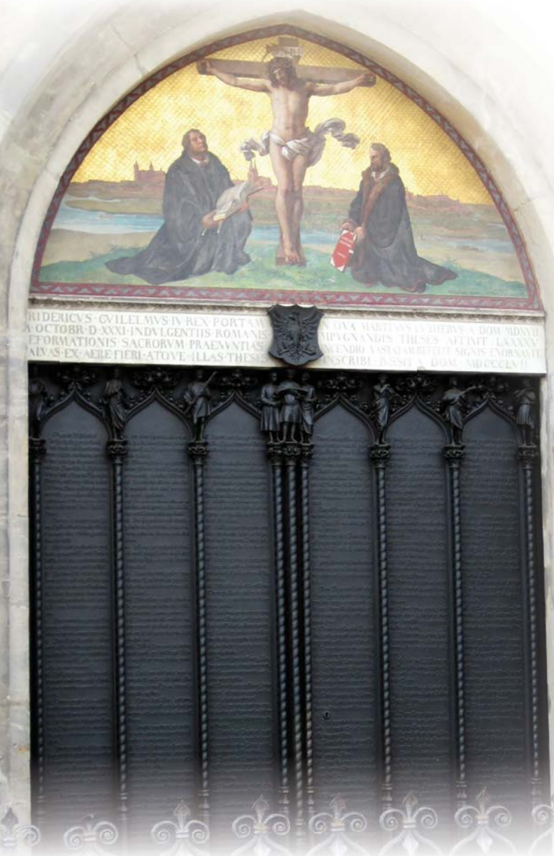
圖一：重修後的威丁堡城堡教堂，刻有「九十五條神學論綱」的大門，上方繪畫耶穌苦像在正中，左邊是路德手持聖經，右邊是墨蘭頓手持「奧格斯堡信條」；另外教堂的鐘樓上刻「上帝為我堅固保障」（EIN FESTE BURG IST UNSER GOTT）。