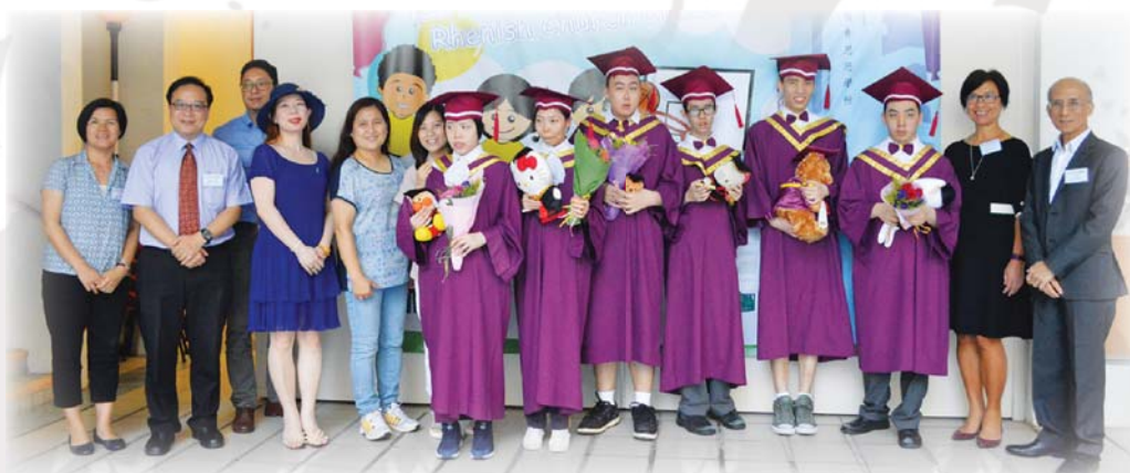
畢業生與嘉賓及校董大合照