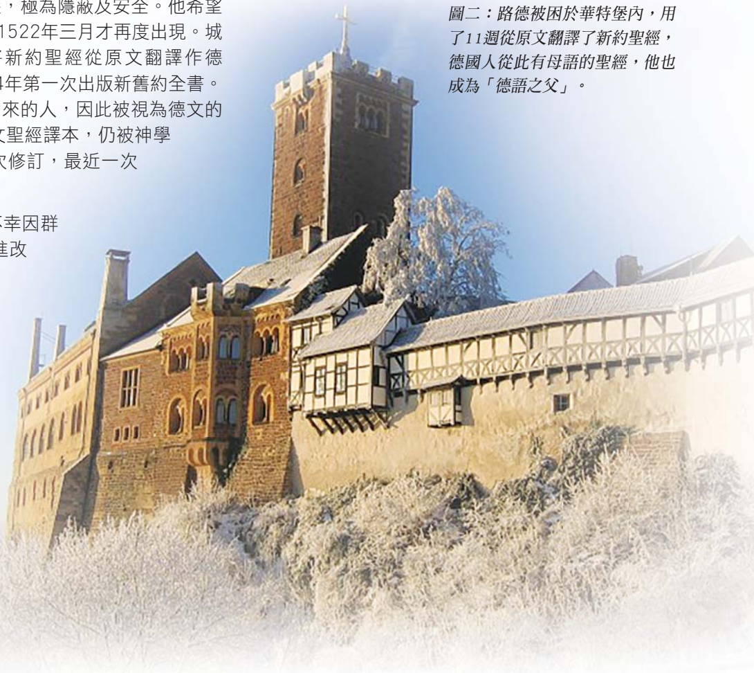
圖二：路德被困於華特堡內，用了11週從原文翻譯了新約聖經，德國人從此有母語的聖經，他也成為「德語之父」。

圖三：斯拜爾的「抗議紀念禮拜堂」，是「萊茵蘭——普法爾茲福音教會」教省的主教座堂，正門中庭雕有路德及各「抗議」的諸侯。