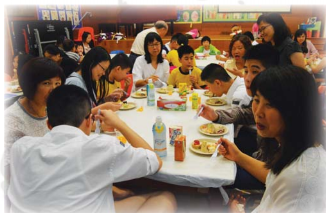
同學及家長們一起參加謝師茶聚