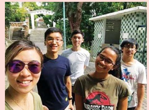
A youth camp on Cheung Chau Island with Tai Po Church

I attended my first Sunday service on the 11th of June. The service was a youth service and the church organised a translator for me. I