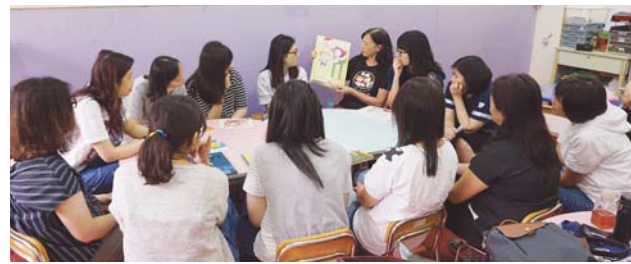
老師分享最愛的幼兒繪本故事