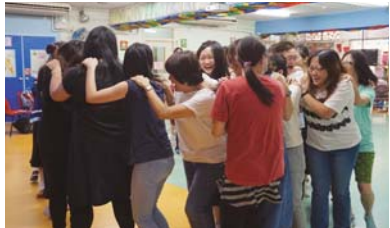
70個成人玩接龍。真的有點驚險