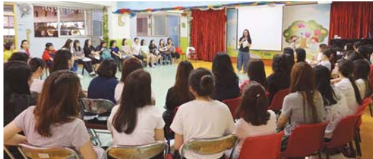
信息分享—我們愛，因為神先愛我們。（約翰一書四19）