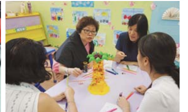
投入遊戲，感受幼兒的緊張