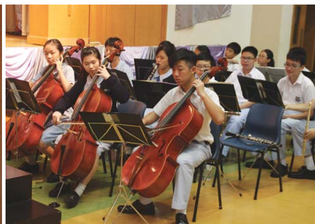
樂團為畢業禮演奏助興