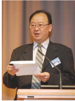
主禮嘉賓 李錦光先生致辭

日期：2017年7月8日（星期六） 時間：下午3時 地點：粉嶺禮賢會中學 主禮嘉賓：教育局學校發展及 行政科首席教育主任（新界） 李錦光先生