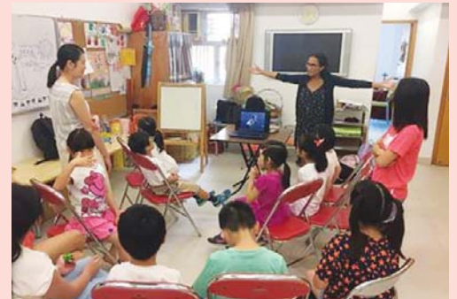
Teaching a Sunday school class an English Sunday school song at Sheung Shui Church