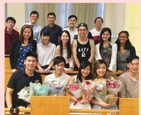
Baptism service in Tai Po Church

I have visited the railway museum and have travelled to different parts of Hong Kong. Hong Kong has a busy life style and is densely populated. Learning the different cultures and ways here in Hong Kong has brought me so much joy and I have grown so much in