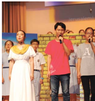
學生表演-新思每篇