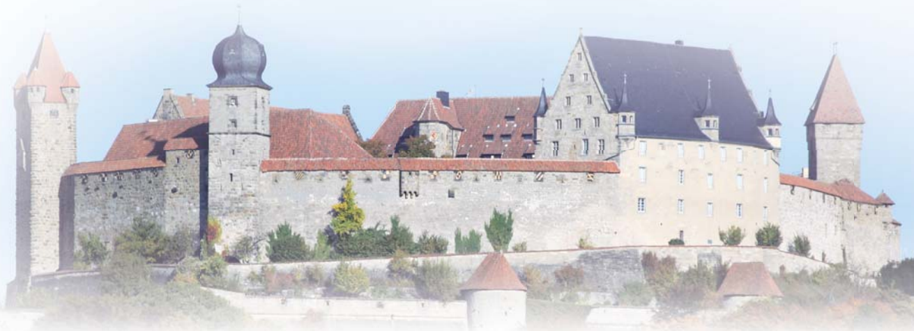
圖四：科堡堡壘（Veste Coburg）是路德1830年在這裡等候奧格斯堡信條成文的地方，科堡城也是禮賢會著名來華宣道士花之安牧師（Ernst Faber）家鄉。