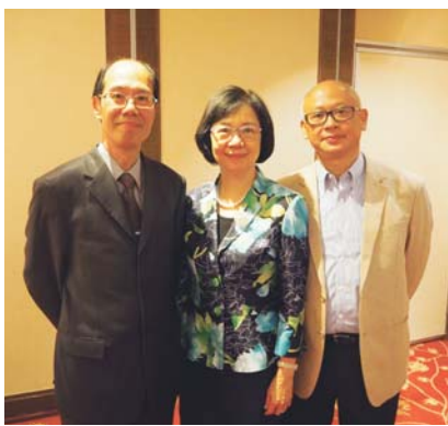
李校長伉儷與教育部長李楚安執事