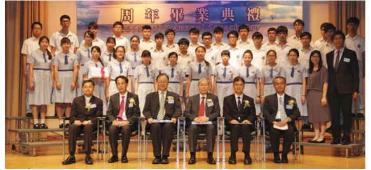
主禮團與6A班畢業生合照