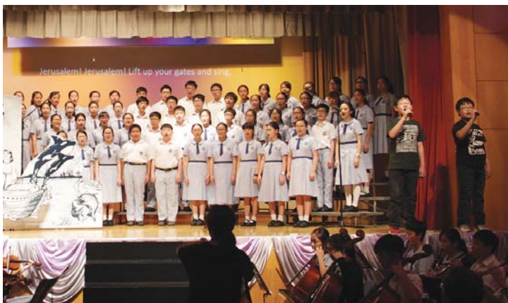
合唱團為畢業禮表演獻唱 The Holy City