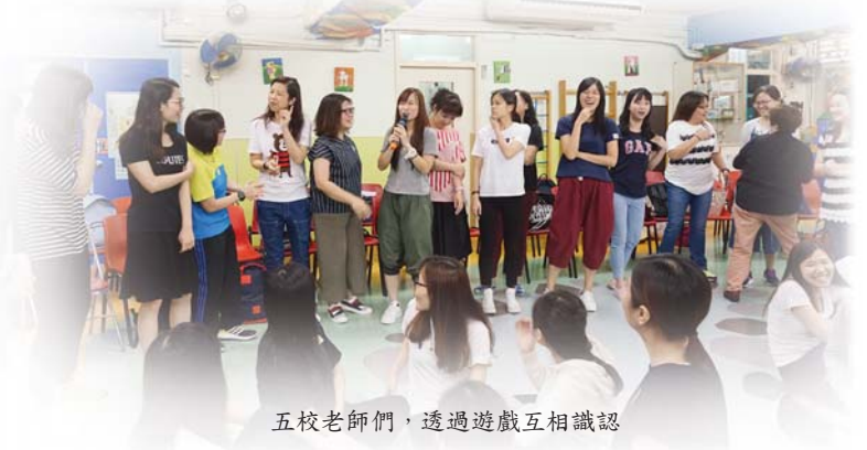
五校老師們，透過遊戲互相識認

日期：2017年7月21日（禮拜五） 時間：上午9時15分至下午5時 地點：上水禮賢會幼稚園 主題：開心聽故事。輕鬆玩遊戲