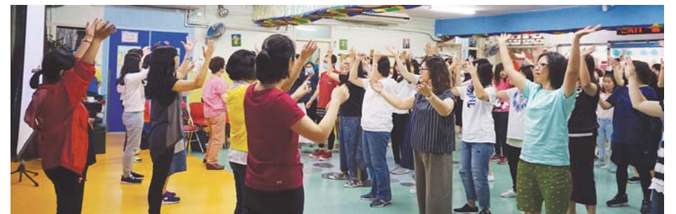
齊唱詩歌，齊做「讚美操」