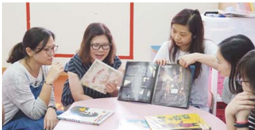
老師們分享最喜愛的圖書