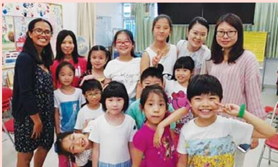
A visit to the Sunday school of The Chinese Rhenish Church of Shueng Shui

The Chinese Rhenish Church has welcomed me with open arms and I am learning so much. My first participation took place at the Chinese Rhenish Church, Sheung Shui. I assisted a Sunday school teacher with her class. I taught the children a Sunday school song in English and spoke to them about where I come from. They were a little shy but eventually warmed up to me. Starting this Godly journey on such a blessed quote made me excited for the journey here in Hong Kong.