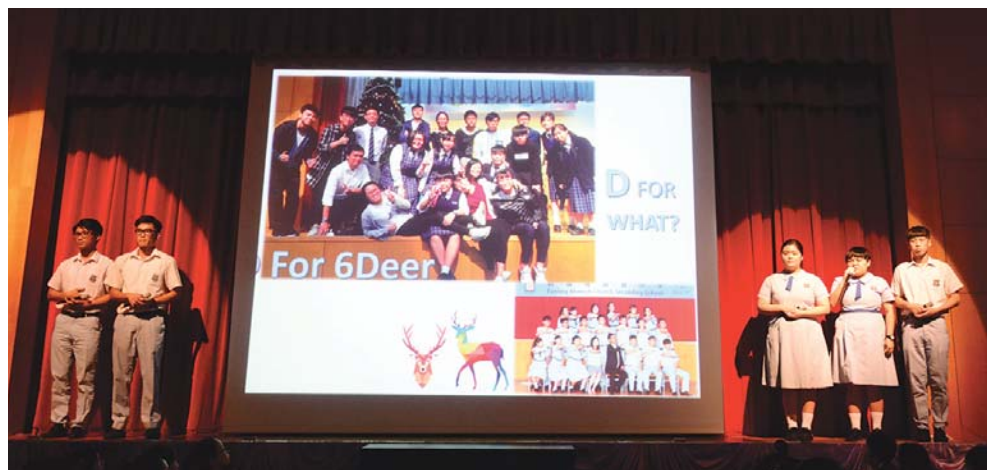
畢業生代表分享畢業感言