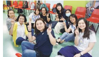
我們玩「一元幾毫」贏出了！