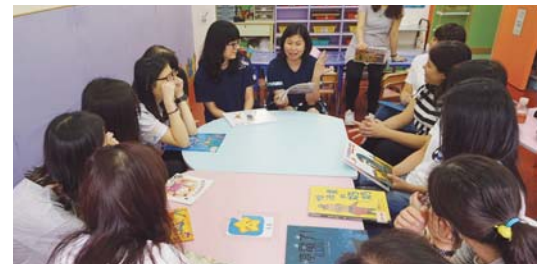
老師分享講故事的心得