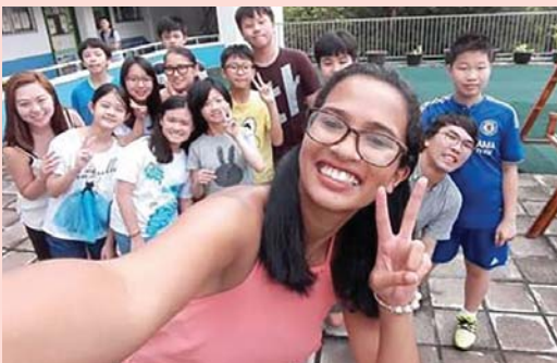
A joyful visit to the Andrew youth fellowship in Tai Po Church

In the Chinese Rhenish Church they organize an after school class called happy Friday. This is where the children normally do their homework. I attended on the 16th of June as I played some English is fun games with the children. This was a lot of fun and the children are slowly warming up to me. The Saturday I attended a bible study class which was really blessed and I could get to know what the young people think about the word of God and how they interpret it. On the 24th of June I attended a church musical which just took my breath away and even though I did not understand the words the music was beautiful as everyone was worshipping and praising God.