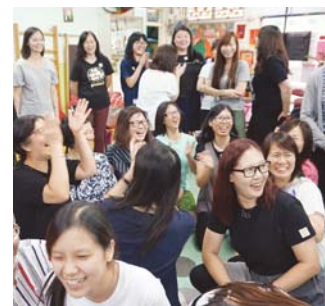
輕輕鬆鬆一同感受遊戲之歡樂