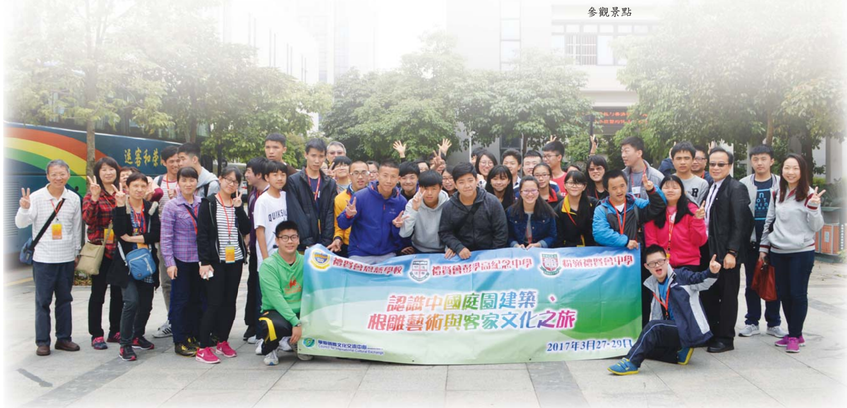
東莞市康復實驗學校